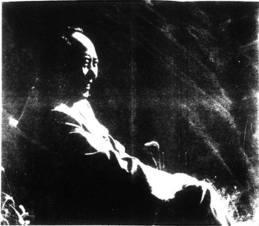
"Lo fundamental del maoísmo es el Poder para el proletariado, para la dictadura del proletariado, basado en una fuerza armada dirigida por el Partido Comunista".

reiterada, de: todos entramos al comunismo o no entra nadie. Dentro de esta perspectiva específica en la época del imperialismo el gran momento histórico de los "próximos 50 a 100 años", y en su contexto el período que se abre de lucha contra el imperialismo yanqui y el socialimperialismo soviético, tigres de papel que se disputan la hegemonía y amenazan al mundo con una guerra atómica frente a la cual, primero hay que condenarla y luego prepararse anticipadamente para oponerle la guerra popular y hacer la revolución. Por otro lado, a partir de la importancia histórica de las naciones oprimidas y más aún de su perspectiva, así como de las relaciones económicas y políticas que están desarrollándose por el proceso de descomposición del imperialismo, el Presidente planteó su tesis de "tres mundos se delinear". Todo lo cual lleva a la necesi-