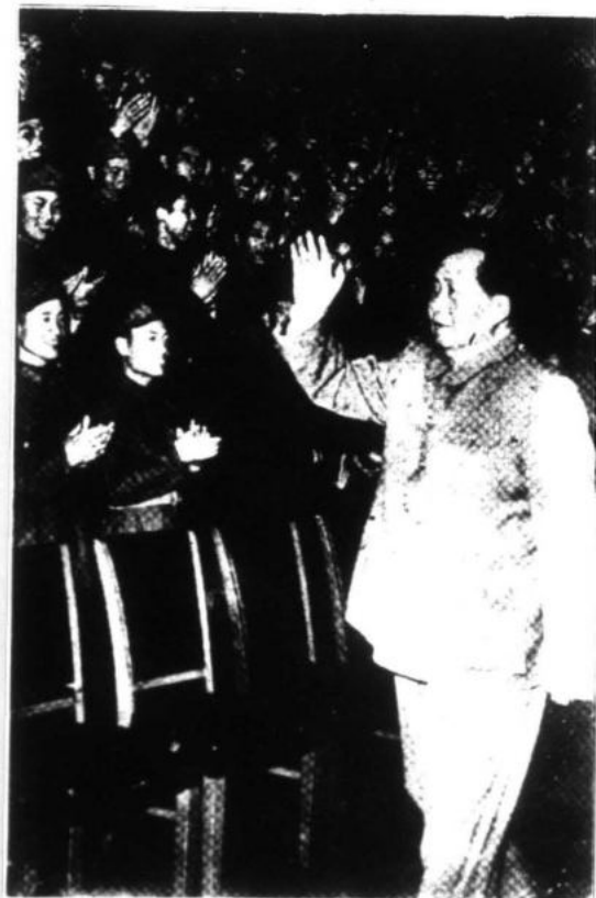
"El presidente Mao fue protagonista y principalmente el más alto dirigente como jefe reconocido de la revolución China"

En cuanto al Partido, el Presidente Mao parte de la necesidad del Partido Comunista, de un partido de nuevo tipo, un partido del proletariado, hoy diríamos un partido marxista-leninista-maoista; un partido cuyo objetivo es conquistar el Poder y defenderlo, por lo cual está indisolublemente ligado a la guerra popular, ya sea para iniciarla, desarrollarla o librarla para defenderse; un partido sustentado en las masas ya sea por la propia guerra popular que es guerra de masas o del frente único que siendo frente de clases se basa en las masas mayoritarias. El Partido se desarrolla y cambia según las etapas de la revolución y los periodos que aquéllas tengan; y el motor de su desarrollo es la contradicción