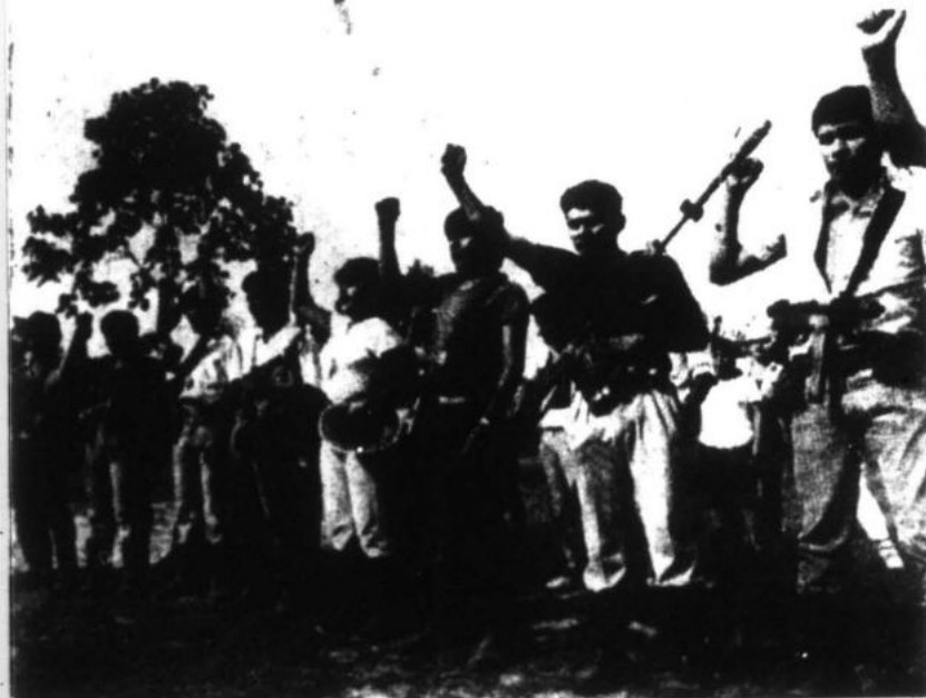
Se apunta a que el marxismo-leninismo-maoísmo, principalmente maoísmo, sea en la teoría y en la práctica el único mando y guía".

Es a través de una persistente, firme y sagaz lucha