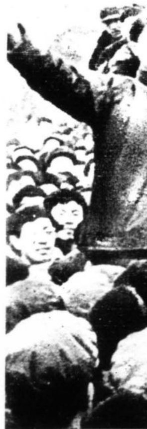
"La revolución cultural proletaria representa una revolución profunda y más amplia..."

A nivel internacional adquiere influencia a partir de la década del 50; pero es con la GRCP que se difunde intensamente y su prestigio se eleva poderosamente y el Presidente Mao pasa a ser reconocido jefe de la revolución mundial y generador de una nueva etapa del marxismo-leninismo; así gran número de Partidos Comunistas asumen la denominación marxismo-leninismo-pensamiento Mao Tse-tung. A nivel mundial el maoísmo se enfrentó abierta y encarnizadamente con el revisionismo contemporáneo desmascarándolo profunda y contundentemente, igualmente lo hizo en las propias filas del P.C.Ch., lo cual elevó más aún la gran