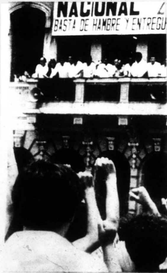
"Combatir el imperialismo, el revisionismo y la reacción indesligable e implacable".