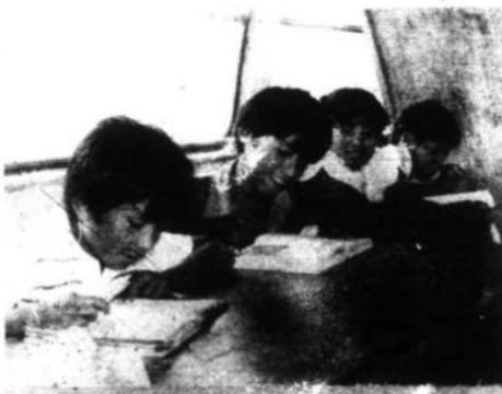
Los niños de este asentamiento humano tienen como aulas de estudio a cinco omnibuses.

Veinte mil pobladores de la Comunidad Autogestionaria de Huaycán realizarán el miércoles 17 una gigantesca marcha por las principales calles de la capital repudiando la política represiva del gobierno y para exigir a las autoridades municipales la inmediata ejecución de los trabajos de electrificación y agua potable.