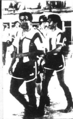
Sporting Cristal, con lo mejor de su escuadra, sale hoy a la caza del puntero Alianza Lima, que también tendrá al "Nene" Cubillas a dos de sus principales jiraras. El choque entre rimenses y victorianos se jugará en Matute desde las 5.30 de la tarde.