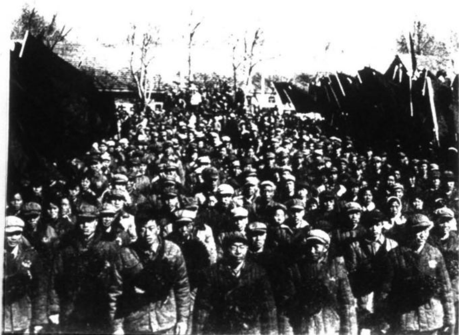
"El Presidente Mao estableció la teoría militar del proletariado, la guerra popular".

6. Revolución mundial. El Presidente Mao acentúa nuevamente la importancia de la revolución mundial como unidad, partiendo de que la revolución es la tendencia principal en tanto la descomposición del imperialismo es mayor cada día, el papel de las masas más inmensas año a año que hacen y harán sentir su fuerza transformadora incontenible y en la gran verdad, por él