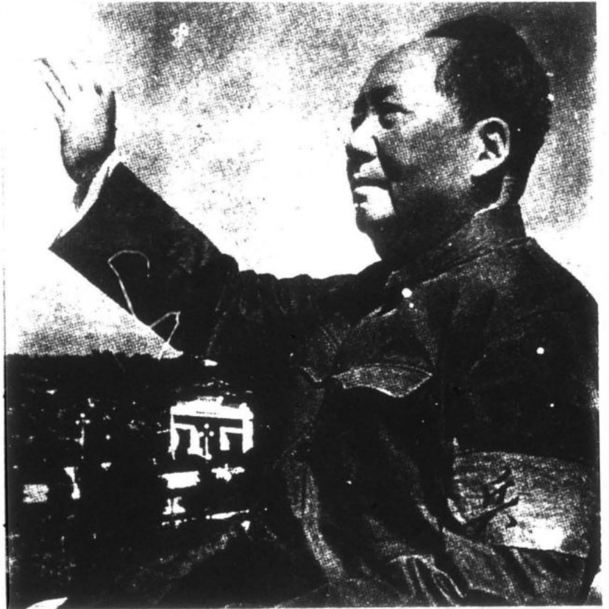
"El Presidente Mao Tsetung, desde la tribuna presidencial Tien An Men, pasando revista, por primera vez, a los grandes contingentes de la Revolución Cultural Proletaria."

A nivel internacional adquiere influencia a partir de la década del 50; pero es con la GRCP que se difunde intensamente y su prestigio se eleva poderosamente y el Presidente Mao pasa a ser reconocido jefe de la revolución mundial y generador de una nueva etapa del marxismo-leninismo; así gran número de Partidos Comunistas asumen la denominación marxismo-leninismo-pensamiento Mao Tsetung. A nivel mundial el maoísmo se enfrentó abierta y encarnizadamente con el revisionismo contemporáneo desenmascarándolo profunda y contundentemente, igualmente lo hizo en las propias filas del P.C.Ch., lo cual elevó más aún la gran