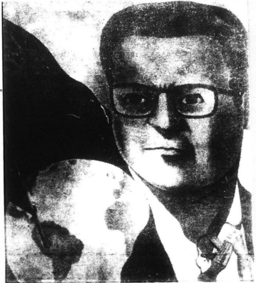
"El pensamiento Gonzalo se ha forjado a lo largo de años de intensa, tenaz e incesante lucha de enarbolar, defender y aplicar el M-L-M...".

Lo fundamental en el pensamiento Gonzalo es el problema del Poder; en concreto, la conquista del Poder en el Perú, cabal y completamente en todo el país, como consecuente aplicación de la verdad universal del marxismo-leninismo-maoísmo a