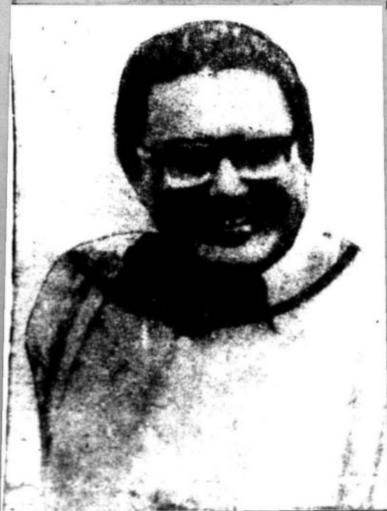
"El Presidente Gonzalo, jefe del Partido y de la revolución".

el proceso revolucionario que dirige, se identifica con el nombre de quien lo plasmó teórica y prácticamente. En nuestra situación este fenómeno se especificó primero como pensamiento guía, luego como pensamiento guía del Presidente Gonzalo y, posteriormente, como pensamiento Gonzalo; porque es el Presidente quien aplicando creadoramente el marxismo-leninismo-maoísmo a las condiciones concretas de la realidad peruana lo ha generado, dotando así al Partido y a la revolución de un arma indispensable que es garantía de triunfo.