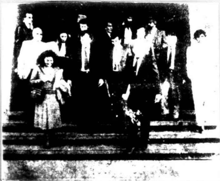
Representantes de la ONU han planteado que la libertad de prensa sea declarada como un "derecho humano básico"

después de todo la "libertad" de prensa tiene carácter de clase y es en función de ella que actúan los diferentes gobiernos; pero en todo caso será un factor más para el desarrollo de la lucha de los pueblos en función de sus legítimos intereses, en este caso de tener sus propios órganos de comunicación.