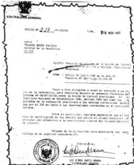
En este documento de la Contraloría ordena sólo aperturar un proceso de determinación de responsabilidades.