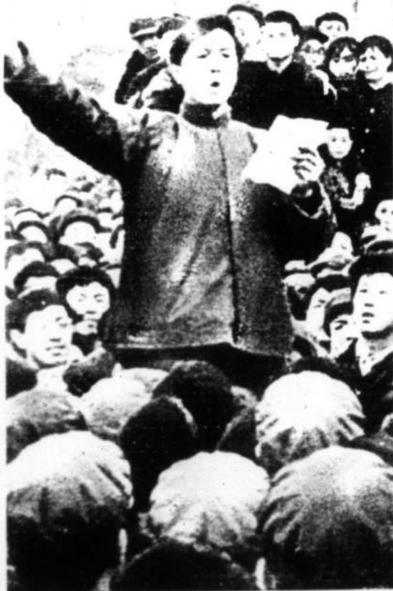
"La revolución cultural proletaria representa una nueva etapa, aún más profunda y más amplia..."

Sobre la LUCHA EN TORNO AL MAOISMO. Escuetamente, en China la