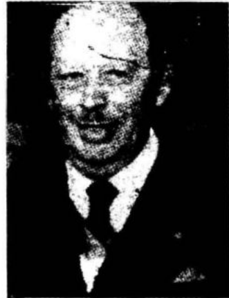
Crecen las manifestaciones de protesta en contra de la dictadura de Alfredo Stroessner a pocas horas de las elecciones presidenciales.

Mientras se desarrollaban los disturbios, el ministro del Interior y presidente del Partido Colorado que postula la reelección del general Alfredo Stroessner para un octavo periodo, Sabino