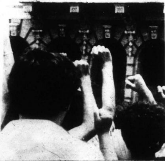
"Combatir el imperialismo, el revisionismo y la reacción indesligable e implacable".