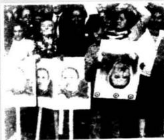
El pueblo chileno opositor a la dictadura de Pinochet es agredido también por grupos paramilitares.

Hubo 85 individuos secuestrados ese año y aunque numerosos reclamos fueron presentados ante los tribunales de justicia, no ha habido arrestos oficiales o procesamiento en ninguno de los casos, en contraste con una celeridad en las investigaciones y los arrestos e inculpaciones por el plagio del coronel Carreño, consignó el informe norteamericano.