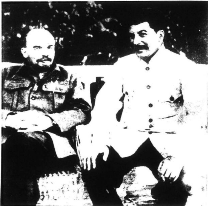
"Stalin planteó justa y correctamente que se había entrado a la etapa del leninismo como desarrollo del marxismo".

2. La Nueva Democracia. Primeramente es un desarrollo de la teoría marxista del Estado el establecimiento de los tres tipos de dictadura: 1) de la burguesía, en las viejas democracias burguesas como Estados Unidos, tipo al cual es asimilable la dictadura existente en las naciones oprimidas como las latinoamericanas; 2) la dictadura del proletariado como en la Unión Soviética o China antes de la usurpación del Poder por los revisionistas; y 3) la Nueva Democracia como dictadura conjunta basada en la Alianza obrero-campesina dirigida por el proletariado