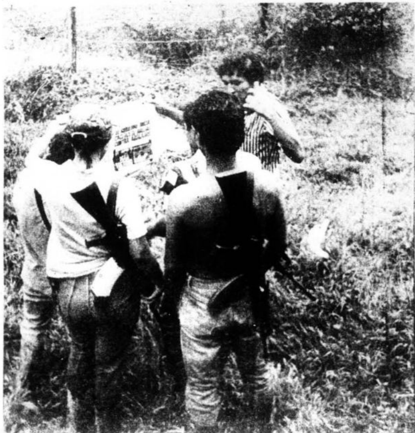
Miembros del Ejército Guerrillero Popular, columna vertebral del Nuevo Estado.

Es el Presidente Mao Tse-tung quien por vez primera desarrolla una teoría comple-