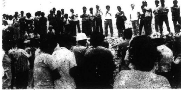
Miles de pobladores de los diferentes AA.HH. del distrito de San Martín de Porres se movilizarán el 17 de este mes exigiendo a las autoridades respectivas que cese los desalojos.