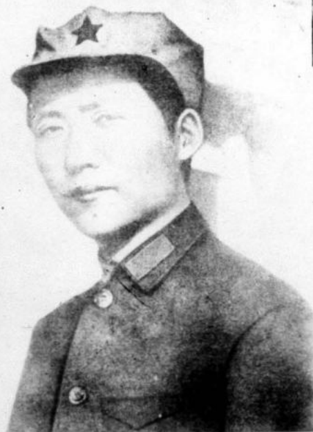
"La ideología del proletariado internacional, en el crisol de la lucha de clases, surgió como marxismo deviniendo marxismo-leninismo y posteriormente, marxismo-leninismo-maoísmo.

En economía política marxista. El Presidente Mao aplicó la dialéctica para analizar la relación base-superestructura y prosiguiendo la lucha del marxismo-leninismo contra la tesis revisionista de las "fuerzas productivas", concluyó que la superestructura, la conciencia pueden modificar la base y con el poder político desarrollar las