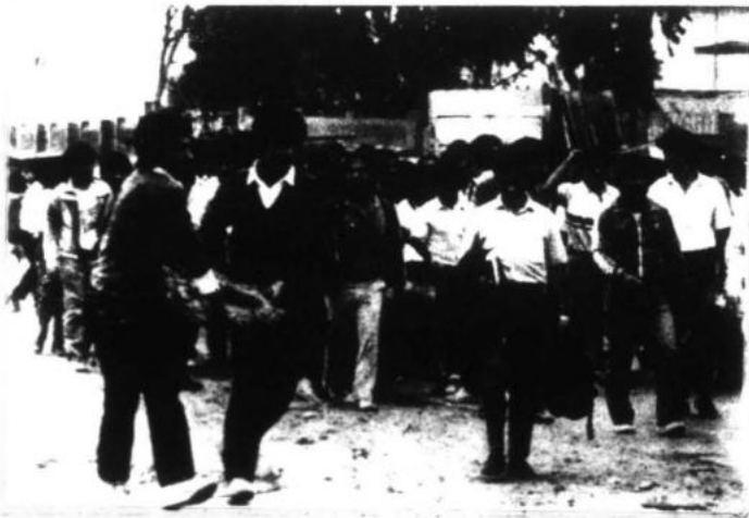
Los estudiantes universitarios de San Marcos, la UNI y La Cantuta efectuaron actos de protesta al cumplirse el primer año de la incursión policial a su casa de estudios.

"Recordemos que hace un año muchos estudiantes fueron salvajemente maltratados y masacrados, para obligarlos a declararse subversivos. Esto no prosperó, ya que la mayoría han sido liberados después de nueve meses al no encontrárseles responsabilidad alguna", acotó.