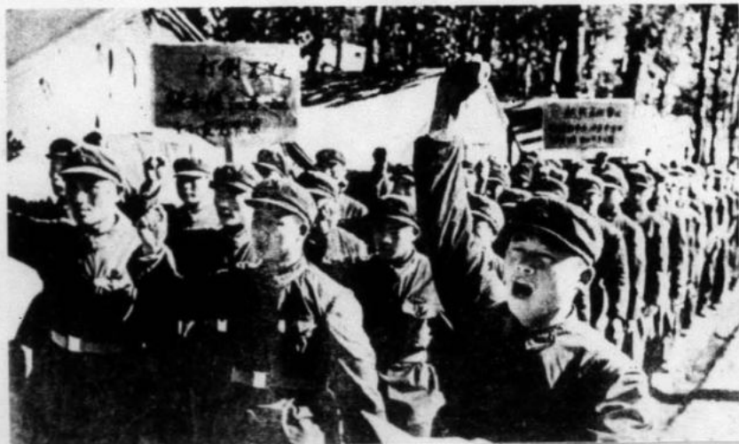
El presidente Mao resolvió la cuestión de la conquista del Poder en las naciones oprimidas a través del camino de cercar las ciudades desde el campo.

sin embargo, hay bastante confusión e incompreensión sobre este problema. Y la misma comienza por cómo se ve la guerra popular en China, generalmente se la considera, reducida y despectivamente como una simple guerra de guerrillas; esto ya denota no comprender que con el Presidente Mao la guerra de guerrillas adquiere carácter estratégico; pero además, no se comprende el desarrollo de la guerra de guerrillas como desde su fluidez esencial desarrolla movilidad, guerra de movimientos, guerra de posiciones, desenvuelve grandes planes de ofensiva estratégica y conquista de ciudades pequeñas, medianas y grandes, de millones de habitantes, combinando el ataque desde fuera con la insurrección desde dentro. Así, en conclusión las cuatro etapas de la revolución china y principalmente desde la guerra agraria a la guerra de liberación popular, considerando entre ambas la guerra antijaponesa, muestran las diversas facetas y complejidades de la guerra revolucionaria librada durante más de veinte años, en una gigantesca población y una inmensa movilización y participación de las masas; en esa guerra hay ejemplos de todo tipo y lo que es principal ha sido extraordinariamente estudiada y magistralmente establecidos sus principios, leyes estrate-