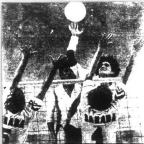
Un triunfo por tres sets a cero consiguió anoche el seleccionado peruano sobre su similar canadiense en el primer de cuatro toques que se realizarán en nuestro medio.

El técnico "edil" sabe de la responsabilidad que se juega en este partido y es por ello que enviará a lo mejor de su vidriera para su compromiso contra los huaralinos, quienes también saldrán en busca de un triunfo para acrecentar sus posibilidades de ingresar al hexagonal con una bonificación de dos y un puntos si se ubica; al final del Descentralizado,