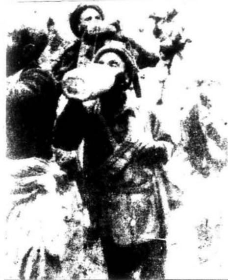
El socialimperialismo comete todo tipo de genocidios y crímenes contra las poblaciones civiles afganas.

no habrá maniobra ni convivencia que impida que el socialimperialismo soviético sea expulsado de los territorios afganos. Aquí no quedará un sólo soldado invasor, dicen los patriotas afganos. Y serán los propios afganos que-