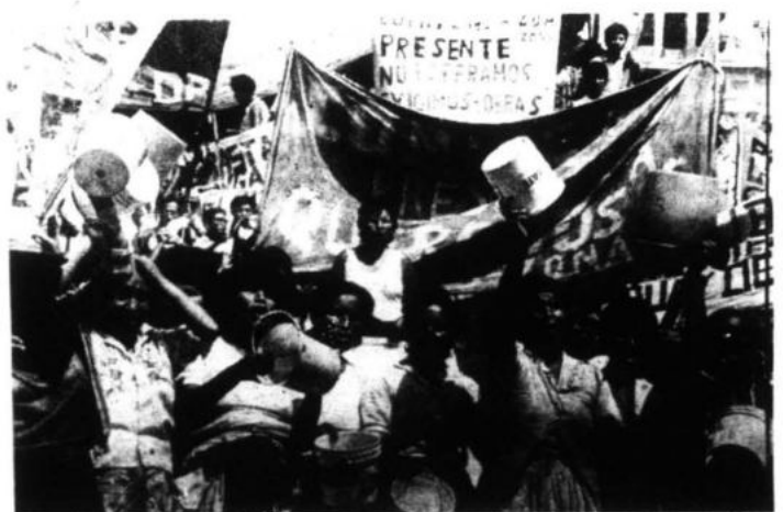
Los habitantes de Huaycán harán una marcha de protesta por las principales calles de Lima demandando la solución de sus problemas básicos: Agua y Luz.

cantidad de dinero para la construcción de verdaderas aulas en la mencionada escuela. Siempre nos han respondido que ello no se va a poder por la falta de presupuesto", agregó.